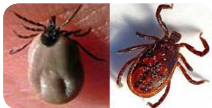
Tique femelle (à gauche) et tique mâle (à droite) " Ixodes ricinus ".

Les provinces en Wallonie les plus exposées sont la province du Luxembourg, le sud de la province de Namur, une partie de la province de Liège, dans le Hainaut autour du bois de Baudour et le Brabant Wallon.