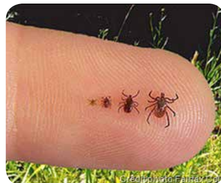
Différentes tailles de tiques.

Tekentiques est un groupe de scientifiques et professionnels de la santé qui œuvre à améliorer la surveillance des tiques en Belgique. Des informations sont présentes sur le site internet. Aidez-les en remplissant le questionnaire en ligne : www.tekentiques.net .