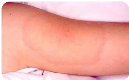
Erythème migrant sur un bras.

La forme européenne de la borreliose de Lyme se traduit par un discret syndrome grippal, presque constant, avec des somnolences importantes (dans 80 % des cas), une fièvre légère (< 38°C), des céphalées (60 %), douleurs articulaires (48 %) et des troubles digestifs (10 %).